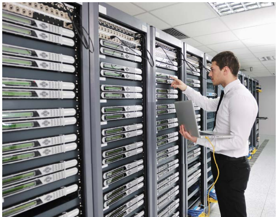
Mit NetApp Technologien können Unternehmen ihre Daten zwischen Cloud-Ressourcen und Service-Anbietern in beide Richtungen verschieben. So muss sich der CIO nicht auf einen Cloud-Anbieter festlegen und kann Ressourcen aus AWS, Azure oder SoftLayer beliebig kombinieren

Kaum ein CIO bekommt ausreichend Zeit, eine organisationsweite Cloud-Strategie von Null auf neu zu planen und einheitlich über alle Organisationseinheiten hinweg einzuführen. Häufig drängen Fachbereiche die IT-Organisation zu schnellen Lösungen, da beispielsweise ein neues Finanzprodukt am Markt eingeführt werden soll. Verfügt die IT jetzt nicht über die notwendige Agilität, beschafft sich der Fachbereich die dringend benötigte IT-Leistung eigenständig aus der Cloud. Dies funktioniert heute mit nur wenigen Mausklicks bei klar kalkulierbaren Kosten sowie definierter Verfügbarkeit. Die IT-Abteilung ist alarmiert, denn langfristig führt dieses Vorgehen in eine Sackgasse und produziert eine schwer kontrollierbare Schatten-IT. Außerdem entstehen verteilte und unter-